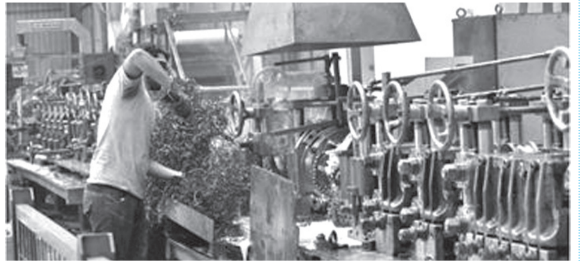
الأنباط - زينة البربر

من قبل الغرفة لافتاً أنها قسمت إلى فئتين، الأولى معنية بمطالبات متخصصة للشركات الصناعية، والثانية فيما يتعلق بمطالبات استراتيجية وذات صلة بالشأن الصناعي بشكل عام، وأضاف أنه تم العمل على معالجة المشاكل الاجرائية بشكل فوري بالتنسيق ومتابعة حقيقية مع كلتا الوزارتين وبشكل حقيقي يؤكد على التشاركية مع القطاع الخاص.