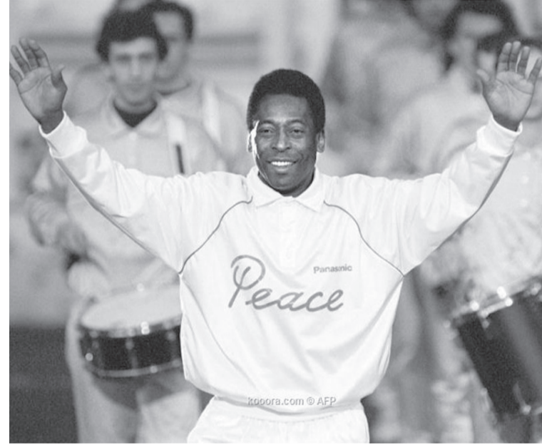
البرازيل - وكالات

المحتجز فيها منذ ٢٩ نوفمبر/ تشرين ثان الماضي. واستحوذت الحالة الصحية لبيليه (٨٢ عاماً) على اهتمام الجميع في البرازيل بعدما أبلغت المستشفى يوم الأربعاء الماضي عن تفاقم سرطان القولون لدى الأسطورة السابق، وهو المرض الذي تم تشخيصه به في عام ٢٠٢١. وأوضح أنه يتلقى الرعاية المتعلقة بـ"اختلال في وظائف الكلى والقلب.. وتم نقل "لجوهرة السوداء" إلى المستشفى لتقييم إجراء تغيير في العلاج الكيميائي، الذي يتلقاه منذ اكتشاف إصابته بالورم السرطاني في القولون، في سبتمبر/أيلول من العام الماضي. وبعد أيام من احتجازه، فأادت المستشفى أنه كان يعالج أيضاً من عدوى في الجهاز التنفسي، بعدما عانى، وفقاً لبياناته، من عدوى كوفيد-١٩.