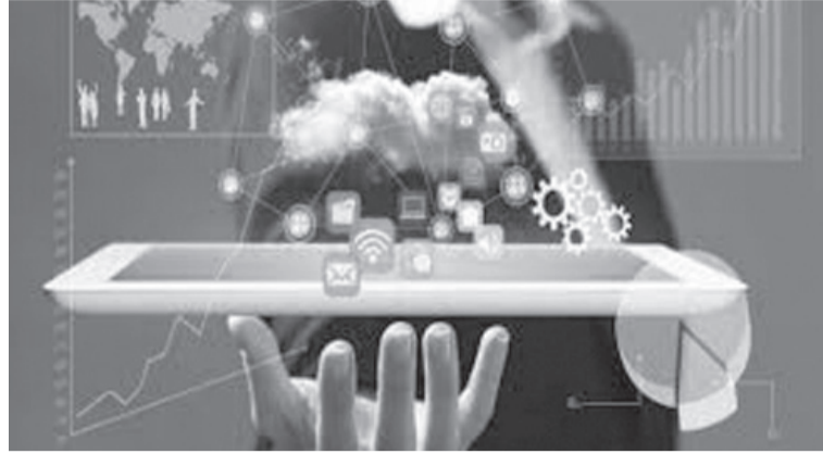
الأنباط - شذى حاتملا

والنصف الأول وجاهي والنصف الآخر الإلكتروني، موضحاً أن المواد العلمية يتم تدريسها في المدارس فيما المواد الأدبية تدرس إلكترونياً، وهنا شكل آخر "التعليم العكسي" أي أن يتعلم ويحضر الطلبة في البيت وتكون المدرسة حلقة نقاشية لهم، وهذا النوع من التعليم يعطي ثقة للطلاب ويخفف من الأعباء على المدارس، مبيناً أنه من الضروري تغيير ثقافة المعلم ووزارة التربية والتعليم وثقافة مفهوم التعليم.