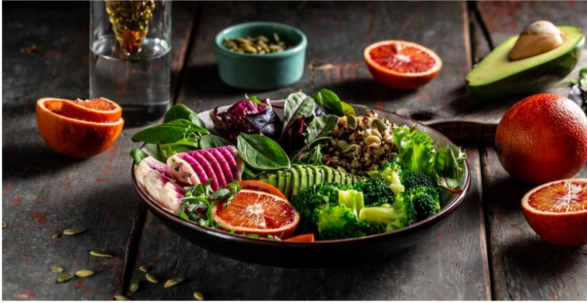
الانبات - وكالات

ولو أن هذه الملوثات التي يحويها السمك تقلقك، فتجنب تناول الأسماك التي تحتل مرتبة عالية في السلسلة الغذائية. فيفضل الأسماك، مثل أسماك القرش وسمك أبو سيف والماكريل المكي وسمك الزمرد، تحوي مستويات أعلى من الزئبق يكون غنياً بكثير من مضادات السردين والأشوجة.