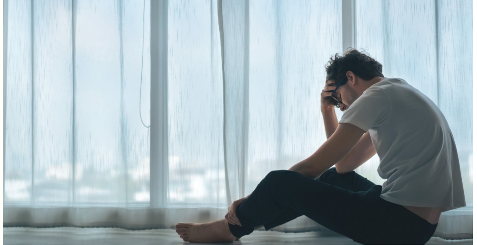
الانبات - وكالات

وبالتالي فإن الحديث مع المريض سيساعده في السيطرة على تشتت أفكاره، ويسهم في التخفيف عما بداخله وشعوره بالاطمئنان ومساعدته على ترتيب الأفكار داخل عقله وحل المشاكل التي تواجهه.