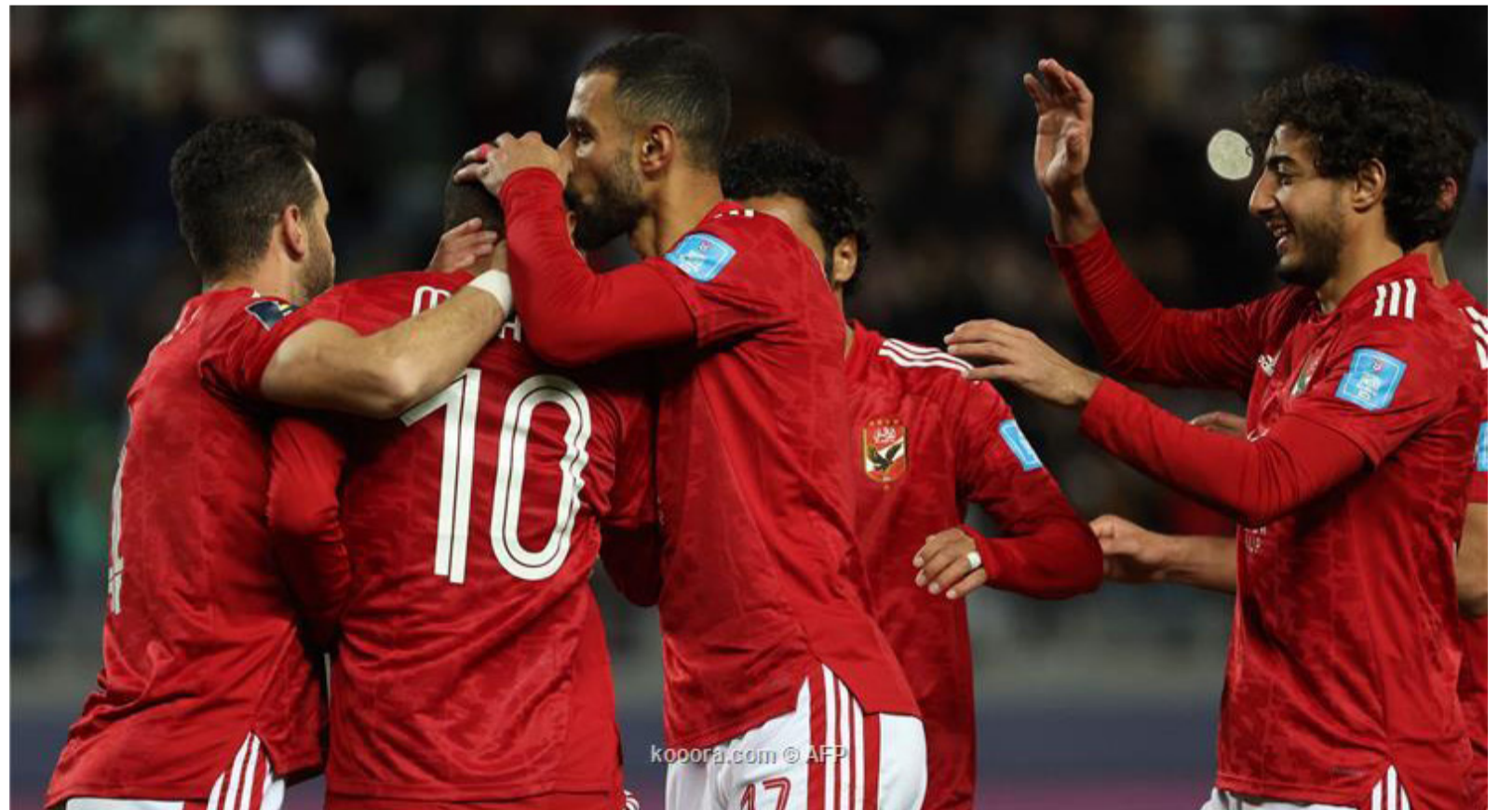
المغرب - وكالات

بالوصول للدور قبل النهائي لمونديال للأندية، بعد فشل لوس أنجلوس جلاكسي في المشاركة بالبطولة في نسخة ٢٠٠١ والتي لم يتم إقامتها بسبب مشاكل مالية. ويمسك برايان شمينتزر مدرب سياتل ساوندرز الأمريكي أكثر من لاعب يمكنه اللعب في عدة مراكز، وهو الأمر الذي يسهل من مهمته في تغيير طريقة لعب الفريق خلال المباراة، ونقله من اللعب بطريقة دفاعية إلى هجومية وهو الأمر الذي قد يمنحه أفضلية كبيرة أمام الأهلي، ومن المنتظر أن يلتقي الفائز من الأهلي وسياتل ساوندرز مع ريال مدريد في الدور قبل النهائي للبطولة. وسيتشهد نفس اليوم قمة عربية يلتقي فيها الوداد المغربي، بطل أفريقيا، مع الهلال السعودي، بطل آسيا، بحثاً عن التأهل للدور قبل النهائي ومواجهة فريق فلامينجو البرازيلي. ويسعى الوداد إلى تكرار إنجاز المنتخب المغربي الذي أنهى بطولة كأس العالم لكرة القدم في قطر،