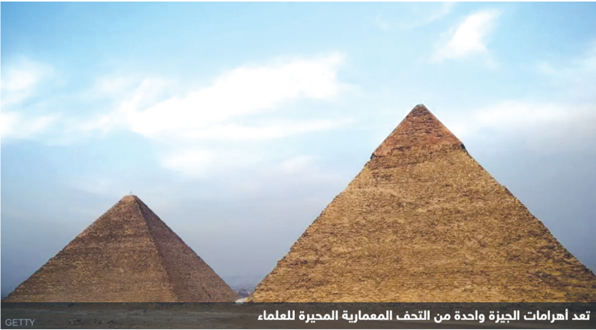
تعد أهرامات الجيزة واحدة من التحف المعمارية المحيرة للعلماء