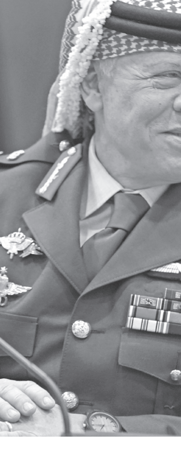
الملك عبدالله الثاني على كرسي الأردن دولة مؤسسات وقانون قائمة على العدل والمساواة والافتتاح وتوفير العيش الكريم لجميع أبنائه، حيث حرص جلالتة على صيانة كرامة المواطن الأردني وتوفير فرص الحياة الكريمة ومحاربة الفقر والبطالة والعمل على تحقيق تنمية اقتصادية واجتماعية يشعر بها الجميع.

وكان جلالة الحسين طيب الله ثراه عند رحيله في السابع من شباط ١٩٩٩ قد أمضى أطول فترة حكم بين جميع زعماء العالم، كما كان يحتل أهمية عظيمة بين المسلمين في شتى أنحاء العالم نظرا لانتمائه إلى الجيل الثاني والأربعين من أحفاد النبي محمد عليه الصلاة والسلام، وسيبقى جلالة المغفور له