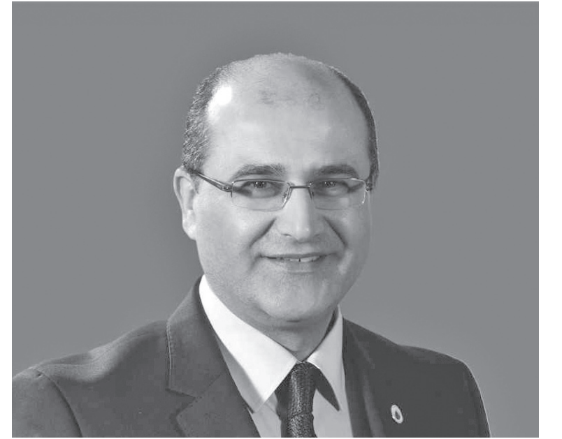
نبض البلد- عمان

براءة اختراع جديدة باسم جامعة الأميرة سمية للتكنولوجيا في مكتب براءات الاختراع الأمريكي، حول "مركبة جوية بدون طيار".