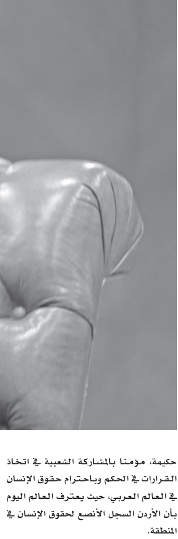
الملك عبدالله الثاني على كرسي الأردن دولة مؤسسات وقانون قائمة على العدل والمساواة والافتتاح وتوفير العيش الكريم لجميع أبنائه، حيث حرص جلالتة على صيانة كرامة المواطن الأردني وتوفير فرص الحياة الكريمة ومحاربة الفقر والبطالة والعمل على تحقيق تنمية اقتصادية واجتماعية يشعر بها الجميع.

وعمل المغفور له على تحويل وتطوير المملكة إلى دولة عصرية تتمتع ببنية تحتية متكاملة ومستويات رفيعة في جميع المجالات مقارنة مع دول العالم النامية، وكان ذا رؤية واضحة