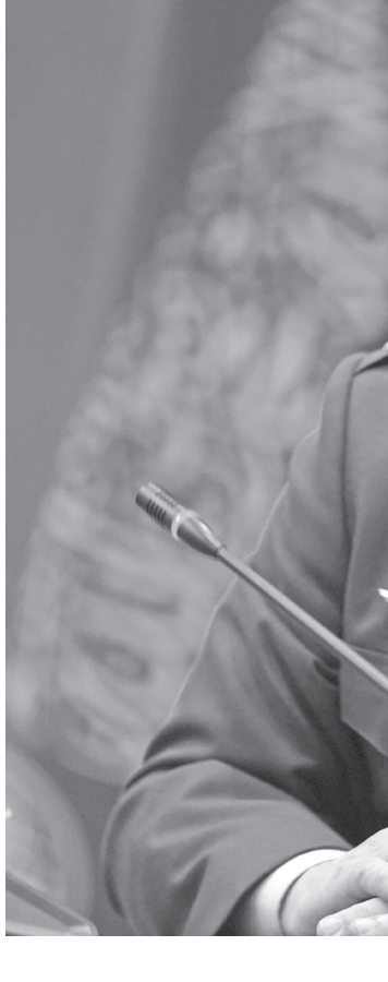
الملك عبدالله الثاني على كرسي الأردن دولة مؤسسات وقانون قائمة على العدل والمساواة والافتتاح وتوفير العيش الكريم لجميع أبنائه، حيث حرص جلالتة على صيانة كرامة المواطن الأردني وتوفير فرص الحياة الكريمة ومحاربة الفقر والبطالة والعمل على تحقيق تنمية اقتصادية واجتماعية يشعر بها الجميع.

لقد تحولت دعوى الأردنيين التي ذرفوها حارة عزيزة على راحلهم العظيم منذ الأسبوع الأول من شباط ١٩٩٩ إلى لبان في مداميك البناء وعضلات السواعد التي حملت معاول الإنجاز التي استنفرها جلالة الملك عبدالله الثاني بن الحسين منذ تسلمه لسلطاته وخلال السنوات الماضية أثبت جلالتة أنه خير خلف لخير سلف.. وكانت حياة جلالتة، كما كانت حياة الراحل العظيم، أزوع تجسيد لأثيل القيم والمبادئ التي ولدت على أرضنا العربية، حيث جمع جلالتة الصفات التي