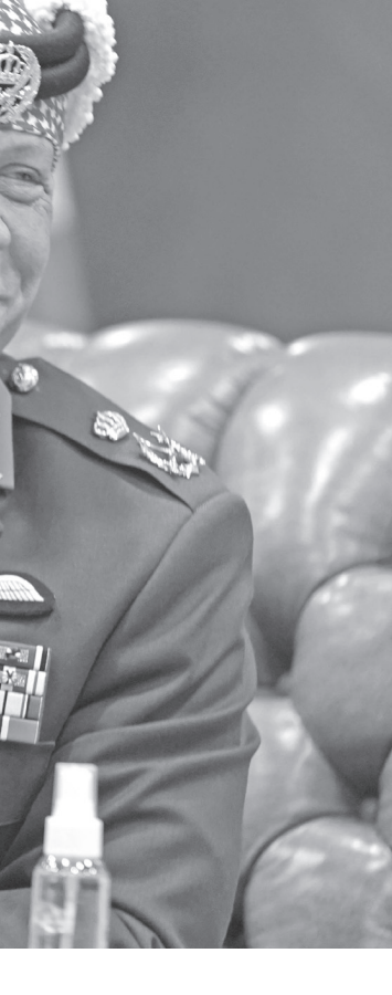
الملك عبدالله الثاني على كرسي الأردن دولة مؤسسات وقانون قائمة على العدل والمساواة والافتتاح وتوفير العيش الكريم لجميع أبنائه، حيث حرص جلالتة على صيانة كرامة المواطن الأردني وتوفير فرص الحياة الكريمة ومحاربة الفقر والبطالة والعمل على تحقيق تنمية اقتصادية واجتماعية يشعر بها الجميع.

ولفت إلى أن العمارة المكتشفة في عين غزال دلت على التنوع والتطور العمراني الذي شهده الموقع خلال مراحل الاستقرار المختلفة، مشيرا إلى أن إنسان عين غزال استطاع آنذاك تقطيع الحجارة والقيام بإنشاء الأبنية التي اتخذت نوعين من العمارة: المساكن والأبنية الدينية. وتحدث عن تماثيل عين الغزال المصنوعة من البلاستر، لافتا إلى أن سكان منطقة عين غزال التي شكلت نواة أول مدينة في تلك الحقبة الزمنية قبل نحو ١٠ آلاف عام كانوا يعرفون الكيمياء. وحول قيمة وتميز الإرث الحضاري في الأردن، لفت المهندس عمارين إلى تأثير تعاقب العديد من الحضارات وما تحمله من إرث ثقافي متنوع ضمن مغلف بيئي متنوع وفريد يمتد على جغرافيا إقليم حول حفر الانهدام (الصدع العظيم). ونوه بما يتمتع به الأردن من تنوع بيئي حيث مناطق البادية والمرتفعات والغورية والمياه العذبة، إضافة إلى المناطق الشرقية من الأردن والتي جميعها شكلت تنوعا حضاريا وثقافيا ما أسهم بجعل سكان الأردن منفتحي الذهن ولديهم القدرة على استيعاب الحضارات الأخرى والهجرات التي قدمت إليهم. كما تحدث المهندس عمارين عن