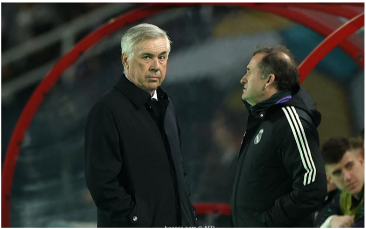
المغرب - وكالات

لمواجهة أوساسونا في المريخ، وأتم: "الشباب أريباس لم يحتج إلى وقت طويل لتسجيل هدفا، وسعيد من أجله، سجل لريال مدريد فينيسيوس جونيور في الدقيقة ٤٢، فيدي فالفيدي (٤٧)، رودريجو جويس (٦٩)، أريباس (٨٠)، بينما أحرز هدف الأهلي الوحيد علي معلول من ركلة جزاء المباراة. "لقد قلت حدة الفريق قليلا، وعانيتا بعض الشيء، لكننا أبلينا بلاء حسنا في النهاية، وأضاف: "سننضم لنا هنا في المغرب ميليتا وبنزيم، بينما سيظل كورتوا في مدريد استعدادا