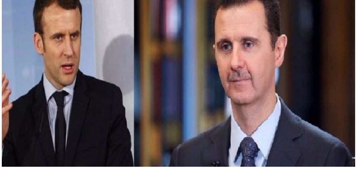
الأنباط - وكالات

قبل أسبوع، أي قبل حدوث الزلزال "هل نبقى نُشاهد خطر مرور القطار واستبعادنا من العملية (في سوريا)؟" مُشيراً إلى أن الرئيس الفرنسي بات يُدرك أن الجميع يتحرك لاستعادة العلاقات مع الحكومة السورية. ونُوّعت اليومية الفرنسية بإيجابية إعادة بعض العواصم العربية مؤخراً التواصل مع دمشق، وفي مُقدمتها أبو ظبي والرياض والقاهرة، فيما الأردن، المنك من استقبال مئات الآلاف من اللاجئين، بيني خارطة طريق دولية للتقارب مع الأسد.