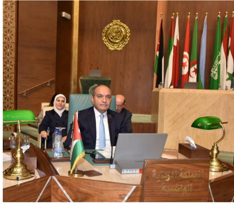
الأنباط - القاهرة

ترأس السفير الأردني لدى جامعة الدول العربية السفير أمجد العضوية، الوفد الأردني المشارك في اجتماعات الدورة العادية الـ (١١١) للمجلس الاقتصادي والاجتماعي، الذي انعقد أمس الخميس على المستوى الوزاري، في مقر الأمانة العامة لجامعة الدول العربية.