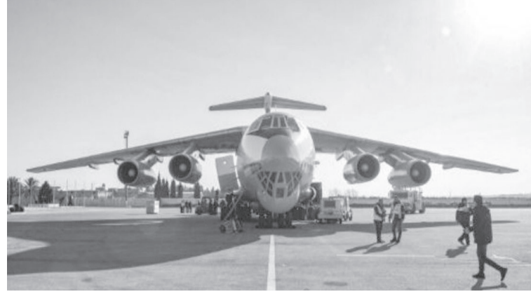
الانباط - وكالات

سوريا عام ٢٠١٨، قبل أن يزور الرئيس السوري بشار الأسد الإمارات في آذار/ مارس الماضي. وتقوم الإمارات حالياً بجهود إغاثية في سوريا وتقدم مساعدات قالت إن قيمتها لن تقل عن مئة مليون دولار. وإلى جانب اتصالات تضامن من حلفائه التقليديين، تلقى الأسد الثلاثاء اتصالاً من نظيره المصري عبد الفتاح السيسي، هو الأول بين الرجلين منذ تولي السيسي السلطة في مصر العام ٢٠١٤، رغم محافظة البلدين على علاقات أمنية وتمثيل دبلوماسي محدود. كما تلقى اتصالاً مماثلاً من ملك البحرين حمد بن عيسى آل خليفة، هو الأول منذ أكثر من عقد.