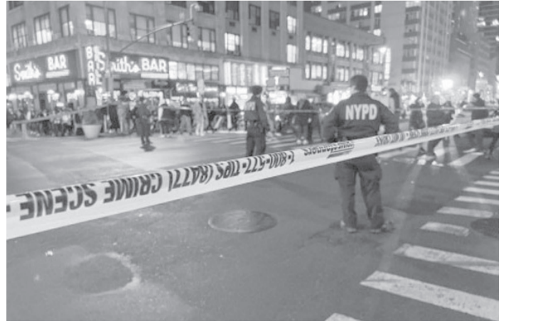
الانباط - وكالات

أحمر وقبعة. وأكد روزمان "لدينا مئات الشرطيين