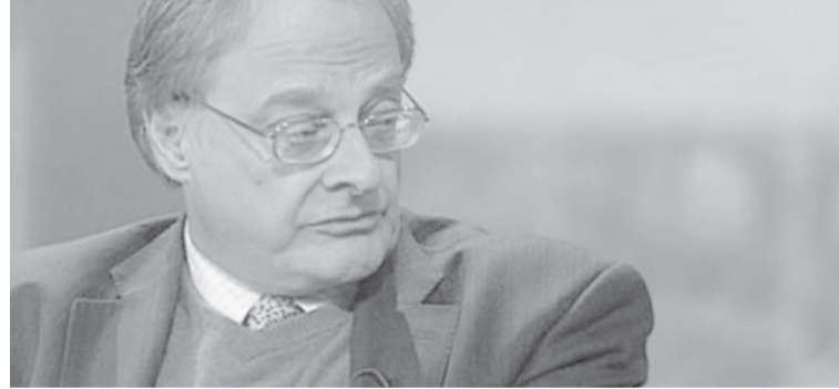
الانباط - وكالات

القتال والحروب. وصف الكاتب البريطاني باتريك كوكبيرن الهجوم الأمريكي على المنطاد الصيني غير المأهول المخصص لأغراض مدنية، أنه رد فعل خطير ومبالغ فيه، ويكشف ولع الأمريكيين الخيف بالقتال والحروب. كوكبيرن أشار في سياق مقال نشرته صحيفة أي البريطانية إلى أن قصة المنطاد الذي لم يكن يشكل أي خطر أثار زوبعة من التهويل في واشنطن والتلويح بالتهديدات والقاء الاتهامات بين الأحزاب الأمريكية، حيث هاجم الديمقراطيون زملعاهم الجمهوريين، فيما اتهم نواب الحزب الجمهوري الرئيس الأمريكي جو بايدن بتعريض أمن الولايات المتحدة للخطر عبر