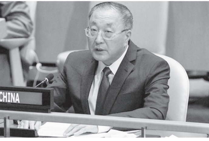
الانباط - وكالات

إذكاء الكارثة الطبيعية، وعدم حرمان الأطفال السوريين من أمهم في البقاء، والكف عن المواقف السياسية النفاقية. إلى ذلك أكد تشانغ أن الأطفال هم الضحايا الأكثر ضعفاً في النزاعات المسلحة، مشدداً على الحاجة إلى البحث عن حلول سياسية للنزاعات والعمل وفق مقاصد ومبادئ ميثاق الأمم المتحدة بحسن نية، ودعم التعددية الحقيقية وتعزيز الحوار والتعاون الدولي. ولفت المندوب الصيني إلى أنه ومن أجل منع وقوع انتهاكات ضد الأطفال بشكل فعال يجب تعزيز روح سيادة القانون، وتطبيق متطلبات القانون الدولي بشأن حماية الأطفال في النزاعات المسلحة.