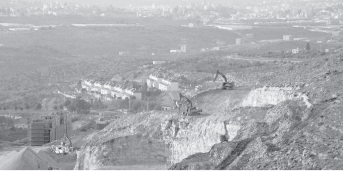
الانباط - وكالات

والثابت، الرامي إلى دعوة المجتمع الدولي للتحرك السريع لوقف هذه الانتهاكات، وتوفير الحماية الكاملة للشعب الفلسطيني وممتلكاته. كما دعت للعمل على وقف هذا القرار الأحادي الجانب، وصولاً إلى الحل النهائي القائم على قرارات الشرعية الدولية، ومبادرة السلام العربية، وإقامة دولة فلسطينية مستقلة على حدود عام ١٩٦٧ وعاصمتها القدس.