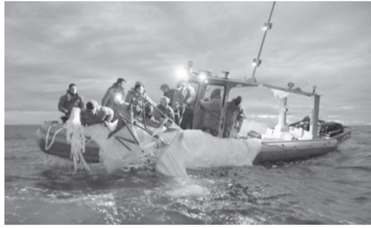
الانباط - وكالات

أسقطت الآن ما إجمالته أربعة أجسام مسيرة، وكان أحدها فوق بحيرة هورون بناء على أمر من الرئيس الأمريكي جو بايدن وقال كيربي للصحفيين في البيت الأبيض يوم الاثنين: تمكنا من تحديد أن الصين لديها برنامج منطاد على ارتفاعات عالية لجمع المعلومات الاستخباراتية مرتبط بجيش التحرير الشعبي وأضاف أن ذلك كان يعمل خلال الإدارة السابقة، لكنها لم تكتشفها. واكتشفنا ذلك. لقد تتبناه. ونحن ندرسه بعناية لتتعلم قدر المستطاع وقال كيربي: نعلم أن مناطق المراقبة (الصينية) هذه عبرت عشرات الدول في القرون متعددة حول العالم، بما في ذلك بعض أقرب حلفائنا وشركائنا. مضيفا أن واشنطن تتشاور مع الحلفاء والشركاء حول هذا الموضوع وقال كيربي أيضاً إن بايدن وجه يوم الاثنين فريقاً مشتركاً بين الوكالات لدراسة الآثار السياسية الأوسع نطاقاً للكشف عن هذه الأجسام الجوية وتحليلها والتخلص منها، والتي قال إنها تشكل إما مخاطر على السلامة أو الأمن