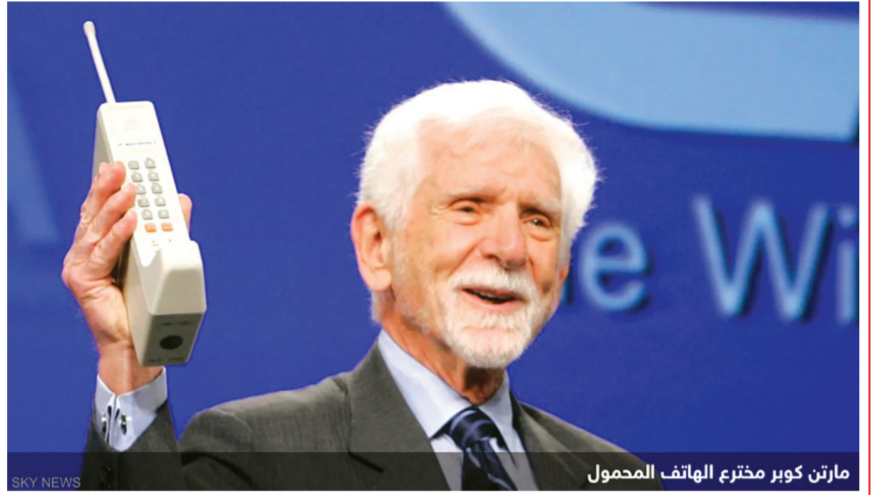
مارتن كوبر مخترع الهاتف المحمول