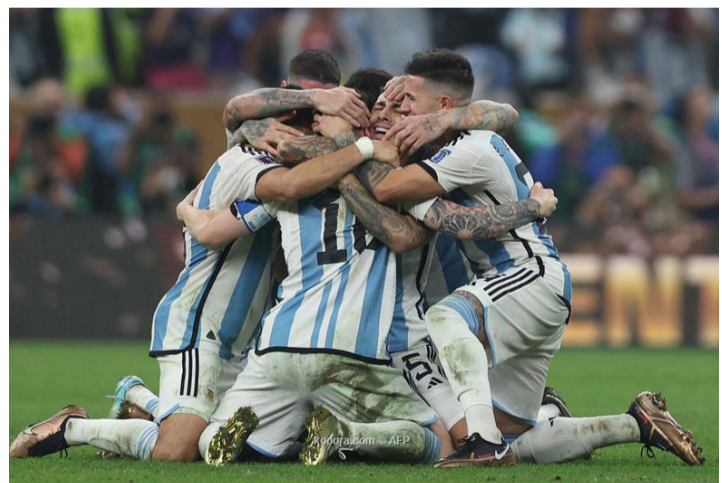
سويسرا - وكالات

وحافظ منتخب المغرب على تصنيفه بالمرتبة الـ١١ عالمياً والأولى عربياً وأفريقياً، بينما حل منتخب السنغال في المركز الثاني على مستوى القارة تونس (٢٨) ثم الجزائر (٣٤)، بينما حقق منتخب مصر فوزاً كبيراً باحتلاله المركز الخامس قارباً والده عالمياً. وعلى مستوى قارة آسيا، حافظ اليابان على الصدارة وحل في المرتبة ٢٠ عالمياً، متقدماً على إيران (٢٤)، كوريا الجنوبية (٢٧)، أستراليا (٢٩). في حين تراجع منتخب السعودية ٥ مراكز ليصبح بالمركز ٤٤ عالمياً والخامس آسيوياً وعربياً. وتراجع منتخب قطر إلى المرتبة ٦١ عالمياً، والإمارات إلى المركز (٧٢) بينما تقدم العراق للمركز (٦٧) وسلطنة عمان (٧٣) و لبنان (٩٩). فيما ثبتت مراكز الأردن (٨٤) والبحرين (٨٥) وسوريا (٩٠) وفلسطين (٩٣) .