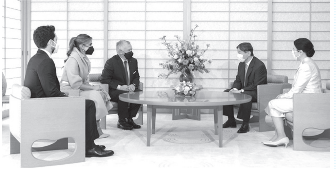
الأنباط - زينة البربور

قد تكون الزيارة الاخيرة لجلالة الملك عبدالله الثاني برفقة سمو الامير الحسين بن عبد الله الثاني ولي العهد الى اليابان خطوة سياسية واقتصادية تشر بأفاق جديدة لتعزيز التعاون بين البلدين خاصة الاقتصادي، فأكّد جلّالته خلال لقائه بإمبراطور اليابان ناروهيتو وعدد من المسؤولين أهمية خطة العمل الاقتصادية القادمة التي تحمل النجاح للبلدين في عدة مجالات تعد الأهم خلال المرحلة الحالية ومستقبلا سعيا لإحداث ثورة اقتصادية حقيقية للبلدين.