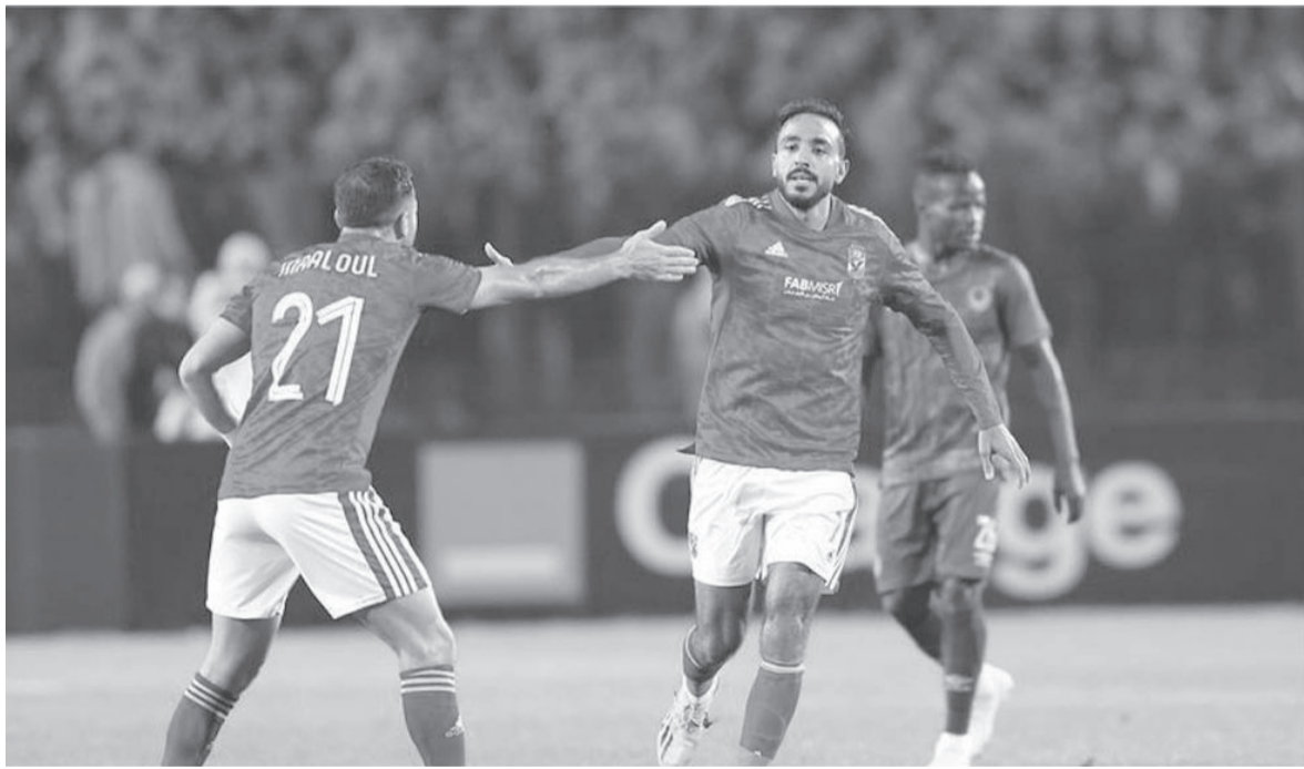
القاهرة - وكالات

إلى صفوف أفيس البرتغالي، ثم انضم بعد ذلك للأهلي.