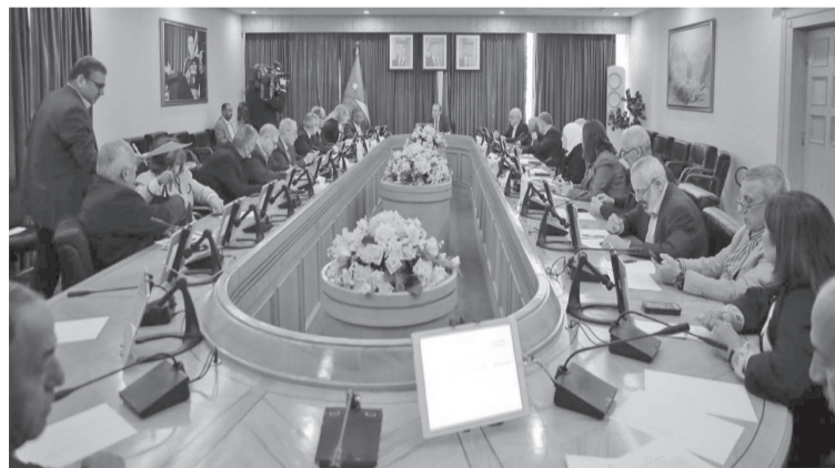
يضيف فئات جديدة للتقاعد، ويكلف الدولة أعباء مالية، بينما أوضحت