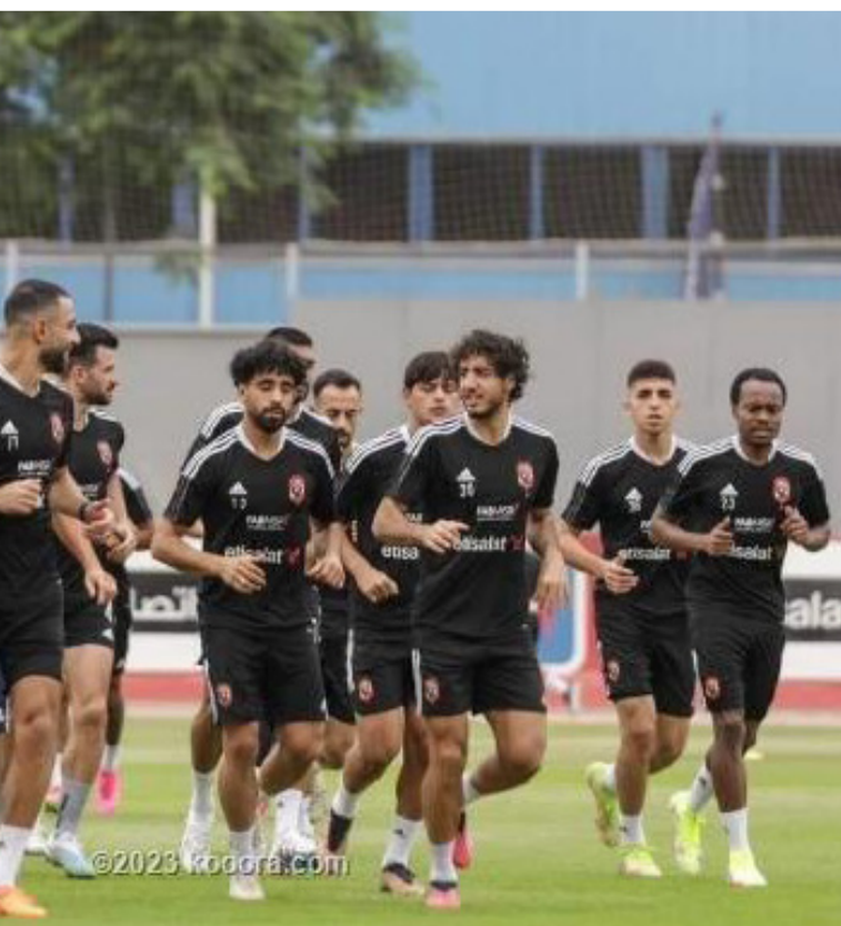
القاهرة - وكالات

الاهلي جاهز للقاء الحسم الافريقي امام الوداد