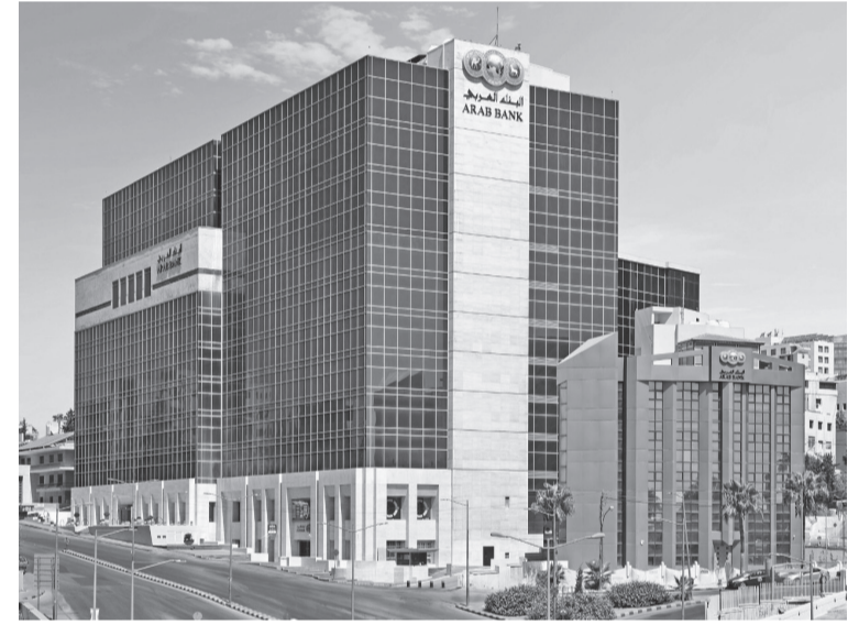
ومقرها نيويورك، وذلك للعام الثامن على التوالي.