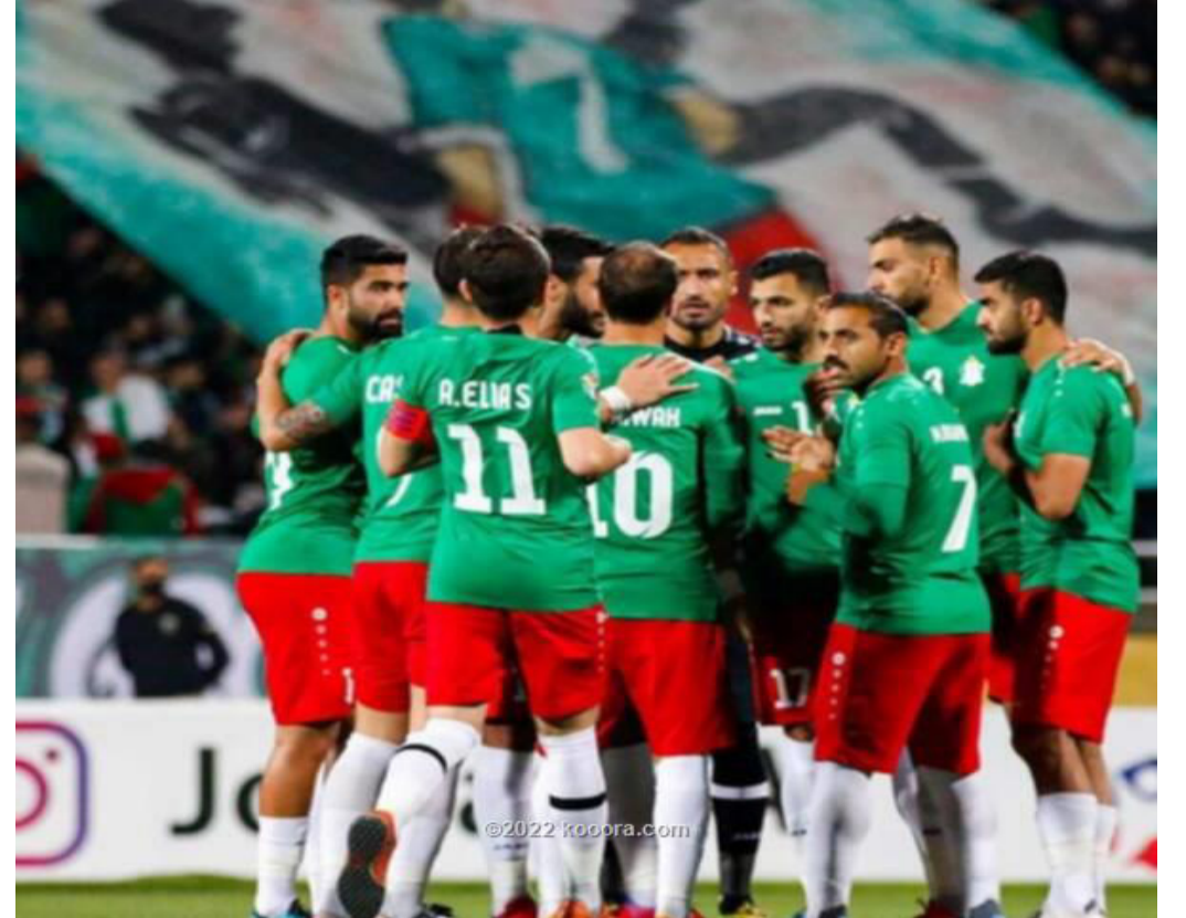
تواصل مساء السبت منافسات الجولة السابعة من