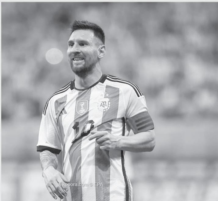
باريس - وكالات

ولفتت إلى أن نيمار باع هذه الجائزة بـ ١٥٨ ألف يورو، في مزاد تابع لمؤسسته الخيرية التي تساعد الأطفال المحرومين في البرازيل. كما أشارت أيضا إلى أن سيرجيو راموس، حصل على هدية ذهبية مماثلة، تحمل الرقم ٤، الذي ارتداه على مدار موسمين بقميص باريس قبل رحيله هذا الصيف بانتهاه عقده. ويستعد ميسي لخامرة جديدة بانتقاله إلى إنتر ميامي الأمريكي، بينما لم يحسم سيرجيو راموس، وجهته الجديدة في ظل تكهنات عديدة بإمكانية انتقاله للدوري السعودي.