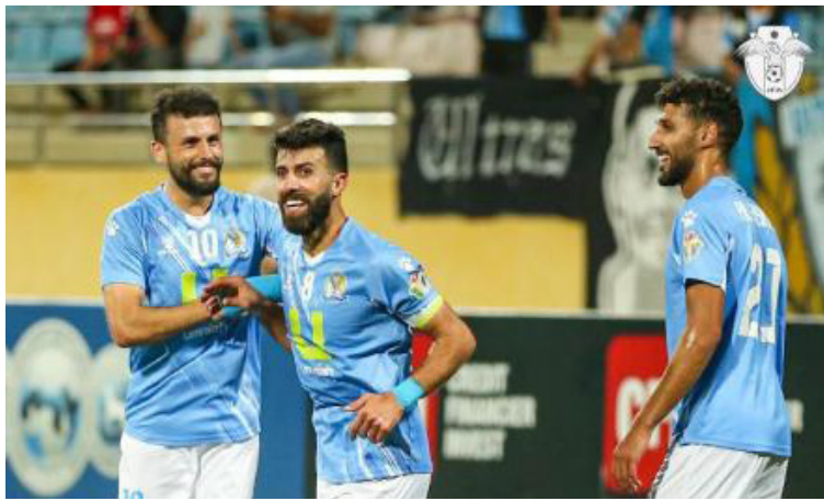
الأنباط - عمان

محلية في الموسم، ما جعله يرفع رصيده إلى 27 نقطة، ويحسم اللقب لصالحه. وتمكن نادي الفيصلي، من تحقيق لقب درع الاتحاد الأردني لكرة القدم للمرة التاسعة في تاريخه، بعدما ابتعد عن أقرب ملاحقيه فريق الرمثا صاحب المركز الثاني في جدول الترتيب الذي جمع 17 نقطة، ومثلها أيضاً للفريق التاريخي الوحدات. تمكن نادي الفيصلي من تسجيل 21 هدفاً، ما جعله أقوى فريق هجومي في بطولة درع الاتحاد الأردني لكرة القدم، بالإضافة إلى صلاية دفاعه، حيث اهتزت شبك حارسه في 3 مناسبات فقط..