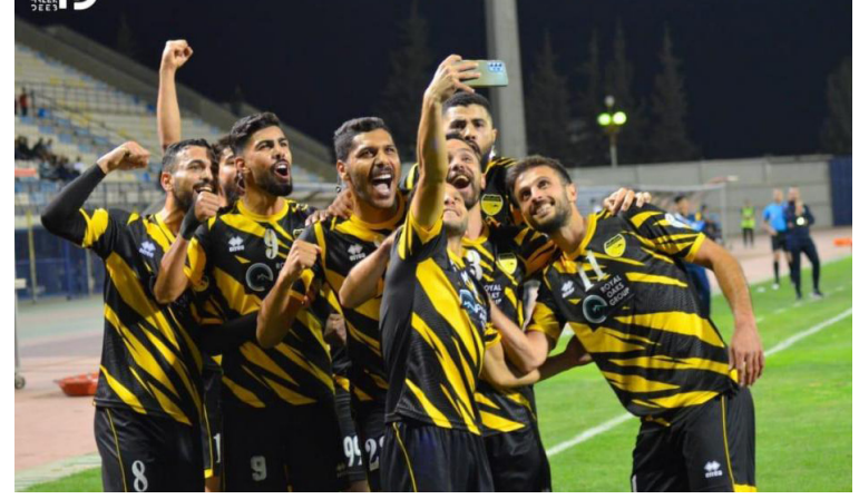
الأنباط - عمان

الحسين إربيد لمصالحة جماهيره الغاضبة عندما يلتقي معان. ولم يقدم الحسين إربيد النتائج المأمولة منه في بطولة الدرع، حيث كان أحد أبرز المرشحين للمنافسة على اللقب، لكنه استنزف نقاطاً مهمة، كان آخرها تعادله مع شباب العقبة سلبياً ليقبى خامساً برصيد 13 نقطة. ويجتهد معان لإثبات نفسه، حيث تعادل في آخر مواجهتين مع الوحدات ثم الجليل وطعم بمفاجأة منافسه بتحقيق نتيجة إيجابية يكون أقلها التعادل، حيث يتبوأ المركز العاشر بـ 6 نقاط