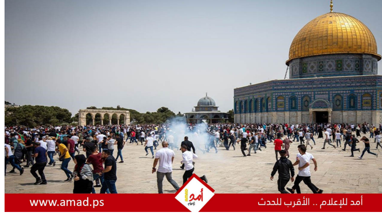
أمد للإعلام .. الأقراب للحدث

أصدرت محافظة القدس تقريرها حول جرائم وانتهاكات الاحتلال خلال النصف الأول من العام الجاري ٢٠٢٣، في العاصمة المحتلة.