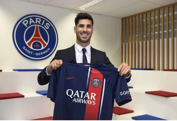
الأنباط - عمان

للإعلان عن الصفقة عبر حسابه على "تويتر"، حيث نشر صورة لعم إسبانيا، ولاعب يمسك هاتفاً محمولاً، وكتب رسالة "أراكم في الثانية مساءً (موعد الإعلان الرسمي)". ويعد اللاعب الإسباني ثاني الصفقات الباريسية هذا الصيف بعد الإعلان عن ضم ميلان سكرينيار، بعقد يمتد حتى صيف 2028. وانضم سكرينيار (28 عاماً) أيضاً في صفقة انتقال حر بعد انتهاء تعاقد مع نادي إنتر ميلان الإيطالي.