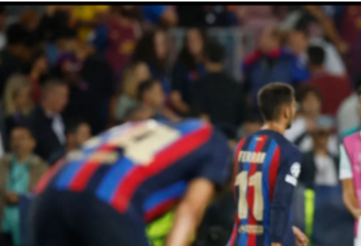
الأنباط - عمان

الجماعي، ويكون أكثر قدرة على المنافسة قارياً، لدينا دافع رد الاعتبار، وأعتقد أننا جاهزون بالصفقات الجديدة واللاعبين المحتمل وصولهم". تابع "أحب مثل هذه الضغوط، فهي طبيعية في ناد بحجم برشلونة، فأنت مطالب دائماً بالعلامة الكاملة، والفوز بكل الألقاب". وأكد مدرب برشلونة أن ناديه يعيش موقفاً معقداً في سوق الانتقالات لتعويض رحيل قائده سيرجيو بوسكيتس. واستدرك تشافي "لكن لن أتحدث عن لاعبين مرتقبين يعقود مع أندية، لأنه