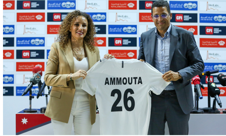
الأنباط - عمان

للمنتخب ومدربين اثنين للياقة البدنية. عموتة أكد أن النتائج لا تتحقق دون إرادة قوية، وقبوله مهمة تدريب منتخب النشأمة جاء بعد شعوره بوجود إرادة قوية لبلوغ كأس العالم، مبيناً أن الأمر يحتاج إلى التزام كبير. "لأنه المنتخب مفتوحة لجميع اللاعبين وكل لاعب يؤدي جيداً من