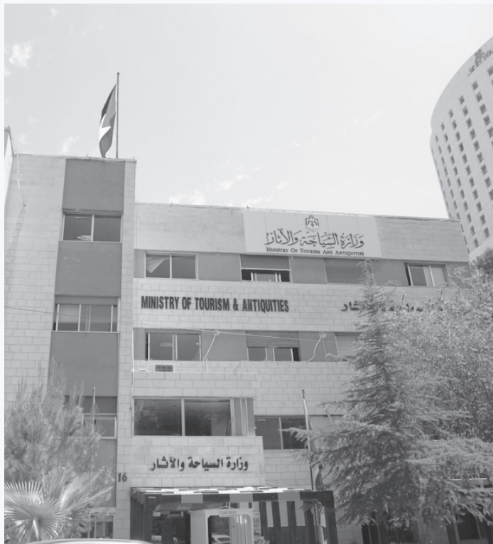
الأبناط - عمان

الاربعاء. وبينت الوزارة أن هذا التعليق يأتي للحفاظ على سلامة المشاركين بالبرنامج، نتيجة الأحوال الجوية المتوقعة وما ستشهده المملكة من ارتفاع في درجات الحرارة خلال الأيام المقبلة.