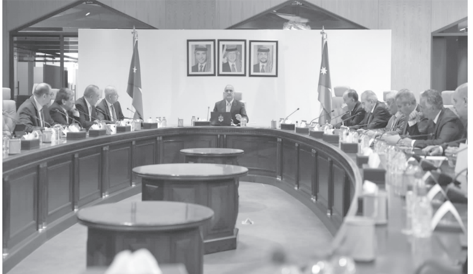
الأبواب - عمان

أقر مجلس الوزراء في جلسته التي عقدها أمس الأربعاء، برئاسة رئيس الوزراء الدكتور بشر الخصاونة، نظاماً معدلاً لنظام التنظيم الإداري لدائرة الإفشاء العام لسنة ٢٠٢٣. ويأتي النظام المعدل لغايات