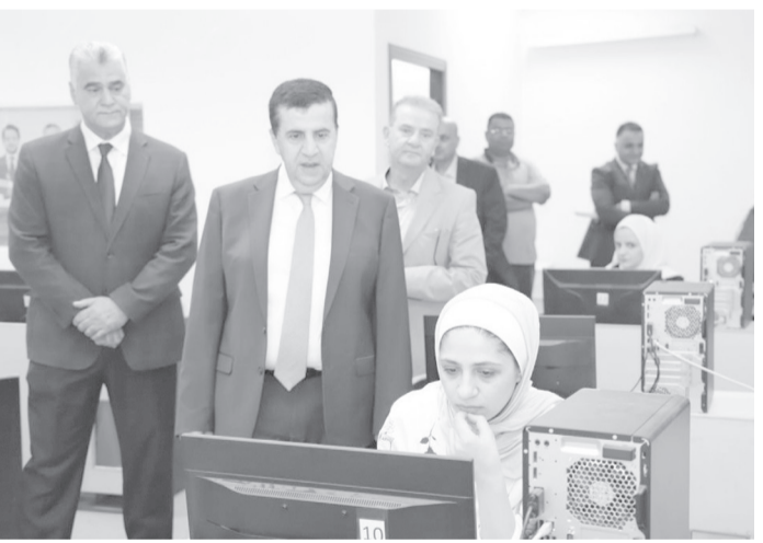
الأبواب - السلط

إجراءات الامتحان والأسئلة، وأبدا ارتياحهم لإجراءات الامتحان، إذ لم تسجل أية شكاوى بخصوص ولم تسجل أي مشكلة تقنية أثناء عقده. وحسب العجلوني، ستعلن نتائج امتحان الشامل للدورة الحالية في النصف الأول من أيلول المقبل، بعد المصادقة عليها واعتمادها من قبل اللجنة العليا لامتحانات ومجلس عمداء الجامعة.