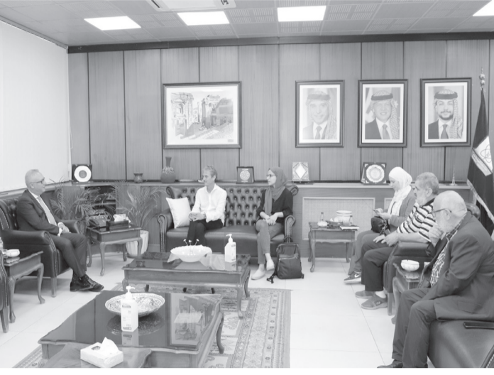
الأبواب - إربد

الكتاب الذي تشرف عليه مكتبة الحسين بن طلال في الجامعة، ما سيكون له الأثر الإيجابي في تطوير وتحسين عمل النادي وتمكينه من تحقيق أهدافه المنشودة. بدوره، أشاد شفيز نسكي بالسمعة العلمية المرموقة للجامعة والمستوى الأكاديمي المتميز لخريجيه، مؤكداً استعداد المؤسسة للتعاون مع الجامعة عبر مد جسور التعاون والتنمية والتطوير في مجتمع مدينة إربد، مشيداً بدعم المؤسسة لـ "نادي