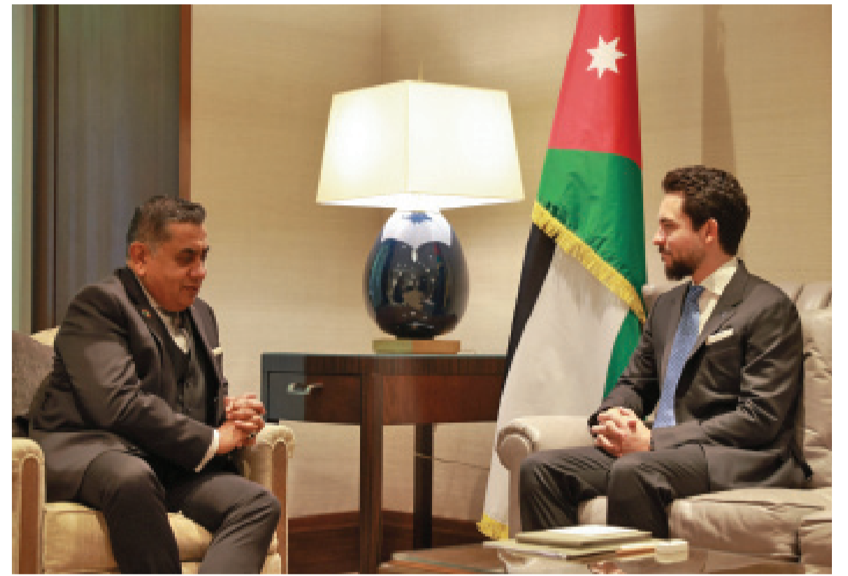
الأنباط - نيويورك

وأكد سمو ولي العهد أن أولوية الأردن في المنطقة تتمثل بضرورة استعادة الهدوء في القدس والضفة الغربية، لافتاً إلى الدور المهم للمملكة المتحدة في هذا الشأن.