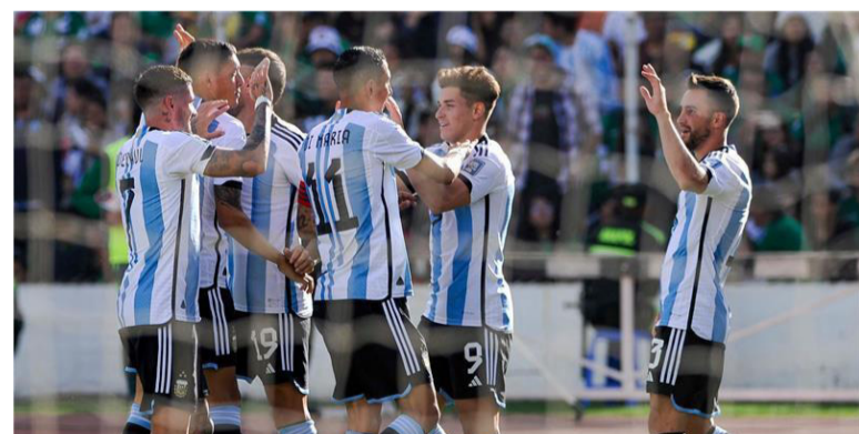
سويزا - وكالات

القمر (١٢٩)، السودان (١٣٠)، الكويت (١٣٥)، اليمن (١٥٦)، جيبوتي (١٩٠)، والصومال (١٩٤). وأوضح الفيفا في بيانه أنه استند في هذا التصنيف على ١٥٩ مباراة دولية بين المنتخبات، أقيمت خلال شهر سبتمبر/أيلول الجاري. أشار إلى أن منتخب أيرلندا الشمالية كان أكبر الخاسرين بتراجعه ١٠ خطوات، ليتواجد في المركز ٧٤، بينما حقق منتخبا غينيا بيساو وأروبا، أكبر قفزة بتقدمهما ٦ خطوات للأمام، ليتواجد في المركزين ١٠٦ و١٩٣ على التوالي. أما منتخب ألبانيا، فقد حقق أكبر تقدم من حيث النقاط (٢٠٠٨) نقطة، ليحتل المركز (٦٢) مستفيدا من فوزه الثمين على بولندا بهدفين، في تصفيات يورو ٢٠٢٤.