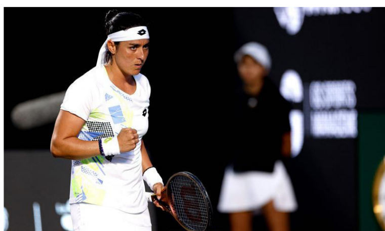
المكسيك - وكالات

٦-٧ (٥-٧) و٤-٦، وتلعب جابر في ثمن النهائي ضد الإيطالية مارتينا ترينفيسان، فيما ضربت ساكاري موعداً مع إيطالية أخرى هي كاميللا جورجى. من ناحيتها، أقرت جارسيا بعد نهاية المباراة "لقد كانت هناك لحظة، بين المجموعة الأولى وبداية الثانية، شعرت خلالها بالفضب من أدائي، لكن شينا فشينا لعبت بشكل أفضل، وتابعت الفرنسية التي ستواجه الأمريكية هايلى بايتيست الفائزة بصعوبة على التشيكية كارولينا بليشكوفا ٦-٧ (٥-٧) و٥-٧ و٦-٧ (٤-٧) " هي ليست المرة الأولى هذا العام التي أضطر فيها إلى إنقاذ نقطة المباراة، وأنا سعيدة للخروج فائزة.