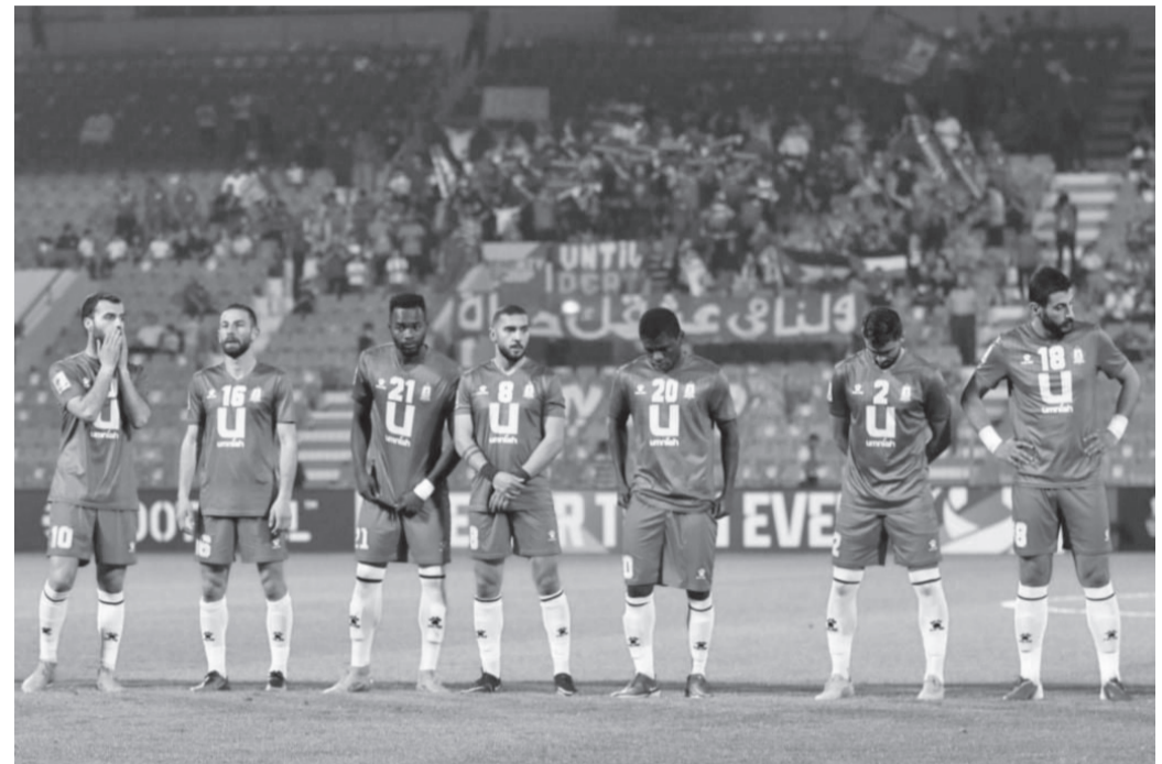
الانباط - عمان الأردن لكرة القدم ويحل صما ضيفا على مغير السرحان عند الخامسة عصر الخميس على ستاد الأمير محمد، ويبدأ تتواصل مساء اليوم منافسات الدور 32 من بطولة كأس

التوقيت يلتقي السلط مع العربي على ملعب السلط، قبل أن يستقبل الوحدات ضيفه جرش عند الساعة والنصف مساءً على ستاد عمان، وينفس التوقيت يلتقي الجليل مع دوقرة على ستاد الحسن. وتختتم مواجهات دور الـ 32 من البطولة الجمعة، حيث يلتقي شباب الأردن مع دير أبي سعيد عند الخامسة عصرا على ملعب البترا، فيما يواجه شباب العقبة نظيره الوحدة عند الساعة والنصف مساءً على ستاد الأمير محمد، ويبدأ التوقيت يستقبل الرمثا ضيفه وادي الريان على ستاد الحسن. وحسب تعليمات البطولة، تقام مباريات هذا الدور وما يليه من أدوار بنظام خروج المغلوب من مباراة واحدة، فيما سيتم اللجوء إلى ركلات الترجيح مباشرة في حال التعادل بالوقت الأصلي. وعلى صعيد المباراة النهائية للبطولة، وفي حال اختلاف الملعب البيتي للفرق المتأهلة، سيتم تحديد مكان إقامتها عن طريق القرعة، وفي حال انتهاء الوقت الأصلي للقاء بالتعادل، سيتم اللجوء إلى الأشواط الإضافية إلى ركلات الترجيح لحسم اللقب، على أن يوزع الربع مناصفة بين الفريقين. ويشهد دور الـ 32، من البطولة مشاركة أندية المحترفين الـ 12، بالإضافة إلى (الجزيرة، الصريح، الهاشمية، السرحان، اتحاد الرمثا، اليرموك، عمان FC، العالية، البقعة، العربي) من دوري الدرجة الأولى، والفرق الـ 10 المتأهلة من الدور التمهيدي: (دوقرة، الطيبة، صما، مرج الحمام، دير أبي سعيد، وادي الريان، الوحدة، حرثا، أم القطين، وجرش)