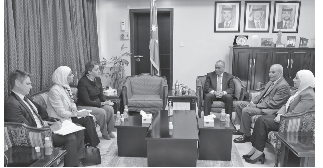
الأنباط-عمان استقبل وزير العدل د. أحمد الزيادات في مكتبه أمس الثلاثاء سعادة السيدة يائل لمبرت سفيرة الولايات المتحدة الأمريكية والوفد المرافق لها بحضور أمين عام وزارة العدل للشؤون القضائية القاضي د. سعد اللوزي، وأمين عام

وزارة العدل للشؤون الإدارية والمالية السيدة خلود العبادي. وفي بداية اللقاء هنأ الدكتور الزيادات سعادة السفيرة لمبرت بتعيينها سفيرة للولايات المتحدة الأمريكية في الأردن وتمنى لها التوفيق في أداء مهامها. كما أكد على عمق العلاقات التي تربط البلدين الصديقين. وتم خلال اللقاء استعراض عدد من المواضيع المتعلقة بقطاع العدالة في الأردن، كما تم استعراض أبرز بنود استراتيجية قطاع العدالة للأعوام (٢٠٢٣-٢٠٢٦) ودور وزارة العدل في تيسير سبل الوصول للعدالة في كافة المجالات وبالأخص التطورات التكنولوجية الحديثة المستخدمة في إجراءات التقاضي كالمحاكمة عن بُعد والخدمات الإلكترونية، وأكد الجانبان على تعزيز التعاون المشترك بين الطرفين. وثمن د. الزيادات الدعم الذي تقدمه الولايات المتحدة الأمريكية لقطاع العدالة من خلال المشاريع الممولة من الوكالة الأمريكية للتنمية الدولية. من جهتها أشارت السفيرة الأمريكية إلى أهمية العلاقة الاستراتيجية التي تربط البلدين الصديقين، وأن الولايات المتحدة الأمريكية ترحب بأدوار الأردن في المنطقة.