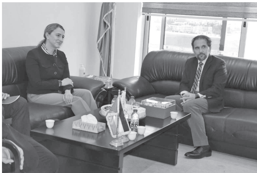
الأنياب- عمان التقى سمو الأمير مرعد بن زعد كبير الأمراء، رئيس المجلس الأعلى لحقوق الأشخاص ذوي الإعاقة، الثلاثاء، سفيرة الولايات المتحدة الأميركية لدى المملكة نايل

لميرت، وبحث سموه مع لميرت أوجه التعاون بين المجلس والحكومة الأميركية من خلال الوكالة الأميركية للتعاون الدولي USAID، ومشاريعها المنفذة في الأردن. وعرض سموه، خلال اللقاء، لواقع الإعاقة في الأردن وما يتم تحقيقه من إنجازات وتحديات تواجه تحقيق الدمج الكامل للأشخاص ذوي الإعاقة في مختلف القطاعات. وأكد سموه اعتراف المجلس بالشراكة القوية والممتدة مع الحكومة الأميركية، مشيراً إلى حرص المجلس على تمتين هذه العلاقة للاستفادة من الخبرات الأميركية الطويلة والقوية في مجال الإعاقة التي أنتجت قانون حقوق الأشخاص ذوي الإعاقة الأمريكي ADA، الذي يعتبر قانوناً رائداً في تعزيز النهج الحقوقي في مجال الإعاقة. بدورها، أعربت السفيرة الأميركية عن سعادتها بزيارة المجلس وتقديرها لجهودهم في زيادة التوعية حول حقوق الأشخاص ذوي الإعاقة في الأردن، وحرصها على استدامة الشراكة المتميزة بين المجلس والسفارة من خلال الوكالة الأميركية للتعاون الدولي، مؤكدة أنها ستواصل تعزيز حقوق الأشخاص ذوي الإعاقة في الأردن. وقدم أمين عام المجلس الدكتور مهند العزة، إيجازاً عن قانون حقوق الأشخاص ذوي الإعاقة، والاستراتيجيات، والخطط المنبثقة عنه، وواقع تطبيق القانون وما تم إنجازه حتى الآن.