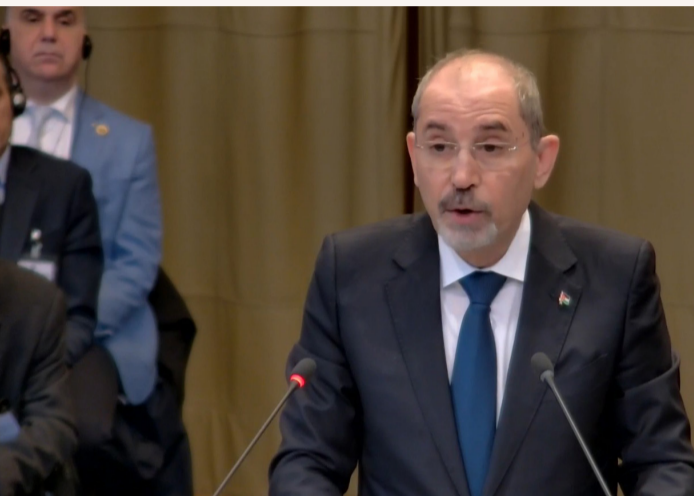
الأنباط - لاهي

السيد الرئيس، أعضاء المحكمة، أقف أمامكم اليوم بينما تتبدى شرور الاحتلال الإسرائيلي دموية ولاإنسانية. يسعر العدوان الإسرائيلي على غزة، الذي رأت محكمكم المؤقرة أنه يستوجب تحقيقاً في ارتكابه إبادة جماعية. يزهق هذا العدوان آلاف الأرواح، ويدمر حيوات أكثر من مليونين وثلاثمئة ألف فلسطيني يعانون قهر الاحتلال من قبل أن يبدأ. نصف مليون فلسطيني في الدرجة الخامسة من التصنيف المتكامل للأمن الغذائي، أي في أسوأ مراحل المجاعة عدهم أكبر من كل البشر الذين يواجهون هذه المجاعة في العالم كله. في غزة،